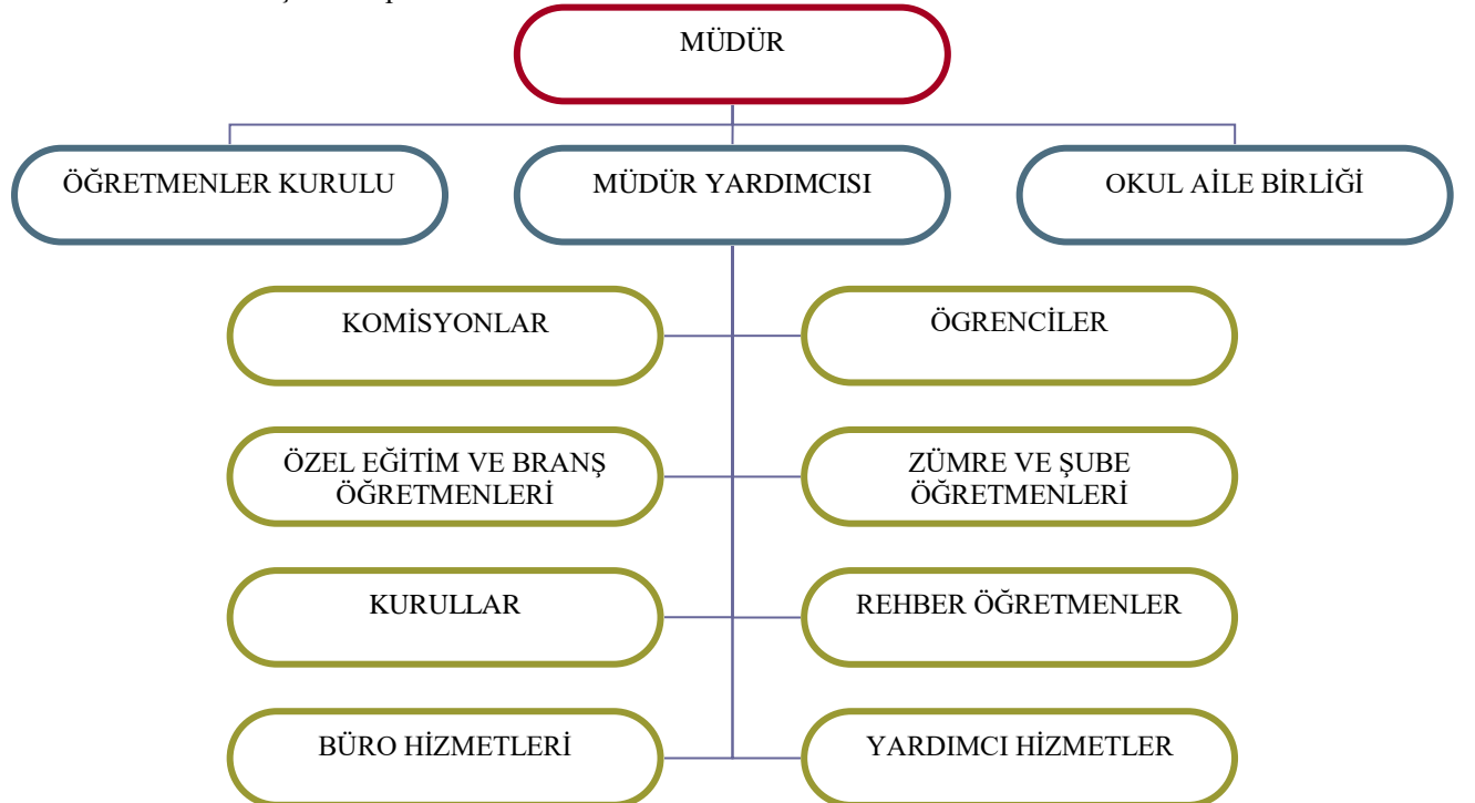
Tablo 8: Okulumuz Teşkilat Yapısı

Okulumuz personeli arasında saygı ve empatiye dayalı bir iletişim, üst düzeyde paylaşım, yardımlaşma vardır. Toplantılarda mevzuat tekrarından daha çok personeli güçlendirmeye yönelik bilgi alışverişine ağırlık verilmektedir. Okulumuzun temel değeri öğrencidir. Okulumuzun tüm çalışanları değerlidir, önemlidir ve kuruma aidiyet duyar.